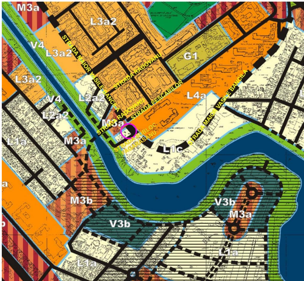
P.U.Z. Sector 2, Bucuresti, aprobat cu H.C.L.S.2. nr. 99/2003, in prezent expirat

Conform PUZ Sector 2, aflat în avizare, terenul este încadrat în zona L1 - subzona locuințelor individuale și colective mici cu max. P+2+M/3Er niveluri.